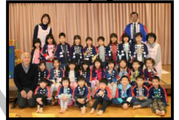
幼年消防クラブ防火ハッピー着用