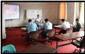
危険物取扱者試験受験準備講習会 (5月、9月、1月)