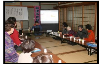
福津市女性防火クラブ役員研修会