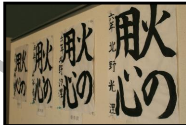
少年消防クラブ防火書道