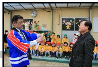
幼年消防クラブへの 防火ハッピーの贈呈