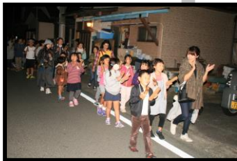
少年消防クラブ防火夜回り