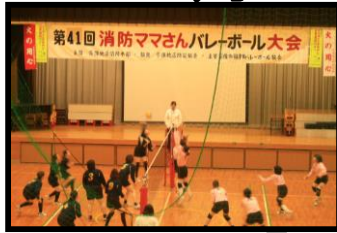
第41回消防ママさんバレーボール大会