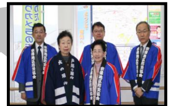
火災予防啓発活動